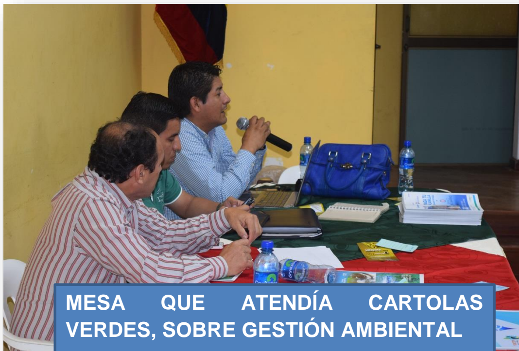
MESA QUE ATENDÍA CARTOLAS VERDES, SOBRE GESTIÓN AMBIENTAL